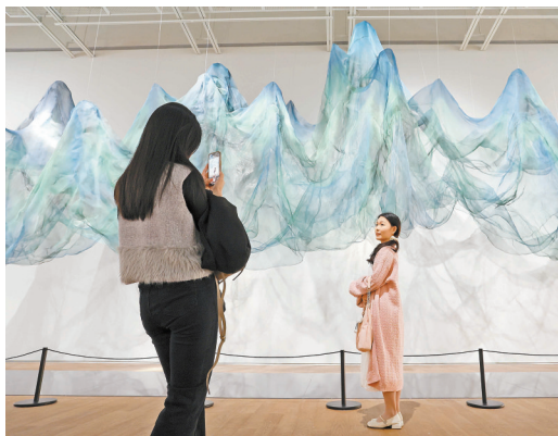
▲与艺术撞个满怀,在鹭湖艺术中心的光影里,留下专属打卡瞬间。