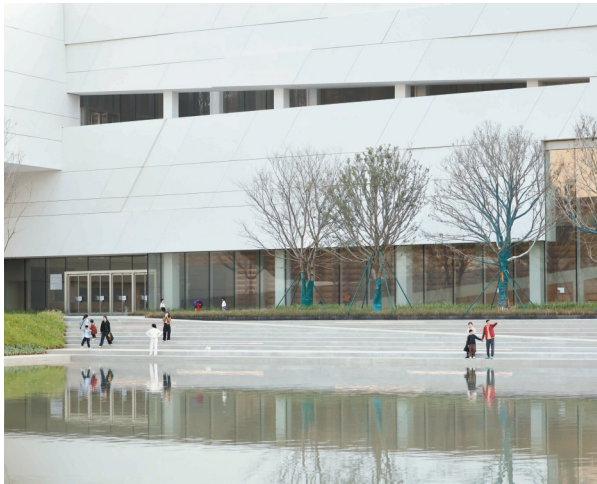
镜头对准鹭湖艺术中心的建筑与湖光,随手一拍都是限定大片。