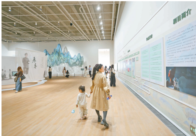
▼市民观看《只此青绿》艺术展。