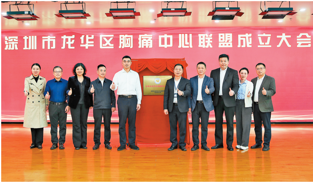
12月18日下午,深圳市龙华区胸痛中心联盟揭牌成立。

龙华区一直严格践行健康中国战略,全力守护辖区群众健康,积极推进胸痛中心建设。目前,区人民医院、区中心医院建成了国家级胸痛中心,辖区73家社康机构建成胸痛救治单元/胸痛救治点,搭建较为完善的胸痛救治网络,为联盟成立奠定坚实的基础。 成立胸痛中心联盟,不是简单的机构拼凑,而是责任共担、